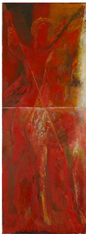
Ольга Булгакова. Всадник (из серии «Библейские эскизы»). Холст, масло. 220 x 80. 2011

Картины Натальи Ситниковой, представителя следующего поколения художников в семье, не столь уж далеки по передаче живописной мощи от работ Булгаковой. Вот только трактуется эта мощь иначе — через цветовые пятна абстрактных полотен. Однако рамки просто картин (от совсем маленьких до огромных) художнице оказываются тесноваты. Она, подобно отцу, начинает конструировать... и использует живописные полотна, как строительный материал для своих арт-объектов. В результате в атриуме галереи появились две композиции. Одна, отдалённо напоминающая противотанковый еж — результат деформации, разрушения строгого порядка, вторая же — чётко упорядоченная — состоит из двух трёхгранных колонн и перекрытия; это некий портал, или дольмен (чем не перекличка с доисторическими «хтоническими» работами матери?). Два объекта — «Вход» и «Деформация» — предстоящие друг напротив друга символ дуалистической переклички порядка и хаоса, их постоянной взаимосвязи и взаимного противостояния.