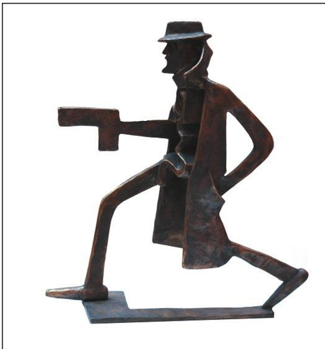
Михаил Дронов. Революционер (Бонч-Бруевич). 2011. Бронза. 29 x 26 x 8 см

примеру, Лётчик привлекает геометрией форм: мощное определение торса на фоне тонко поданных конечностей и цельная голова, которая сама по форме уподоблена некоему летательному или космическому аппарату. Скульптор в этом отношении верен себе, не скрывает желания игры.