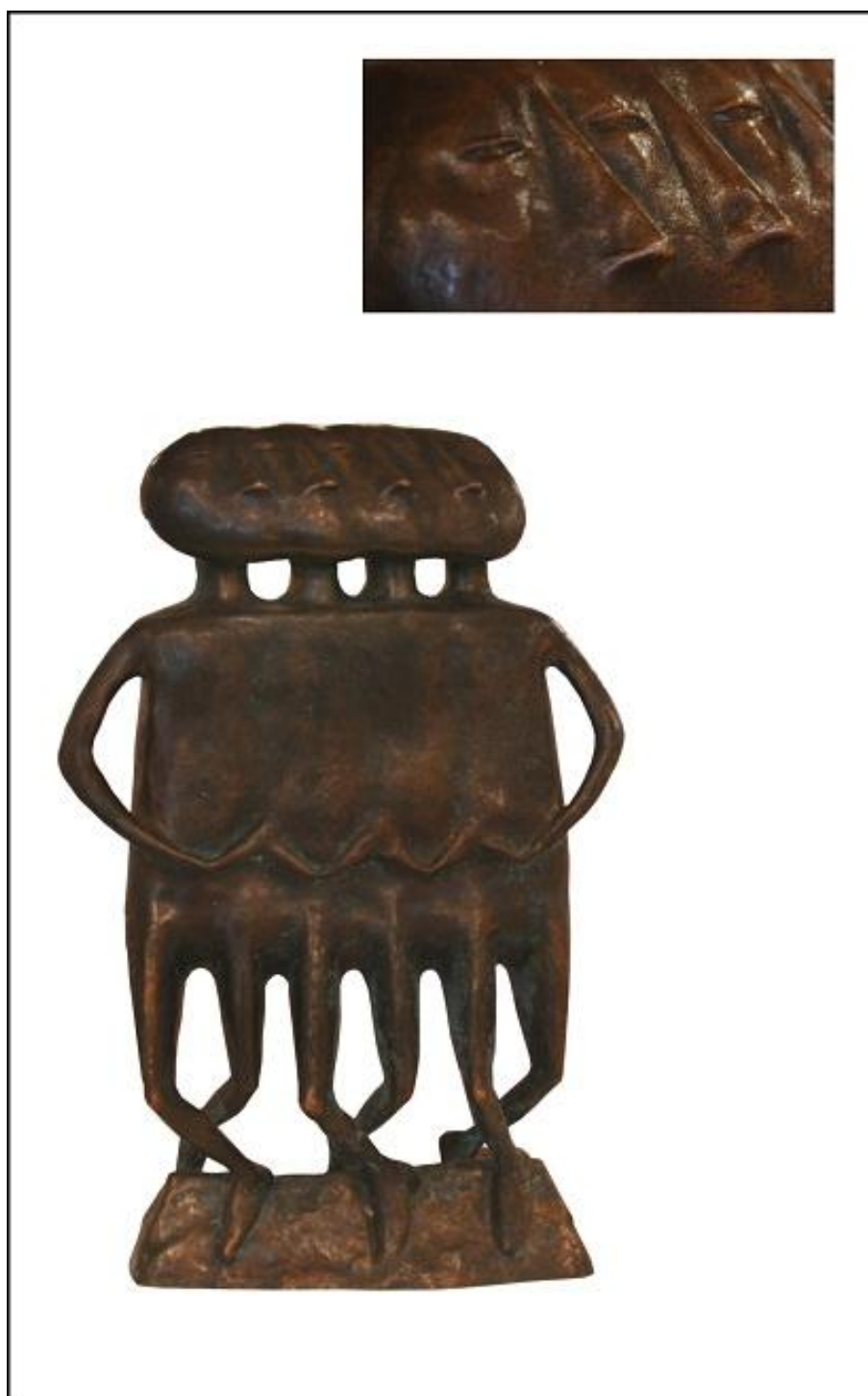
Михаил Дронов. Лебединое озеро. 1994. Бронза. 43 х 27 х 8 см.

лётчик продолжит, любясь, вертеть в руках свой бумажный самолётик. Или и того больше — соберутся, да и натворят вместе чего-нибудь, пошлют.