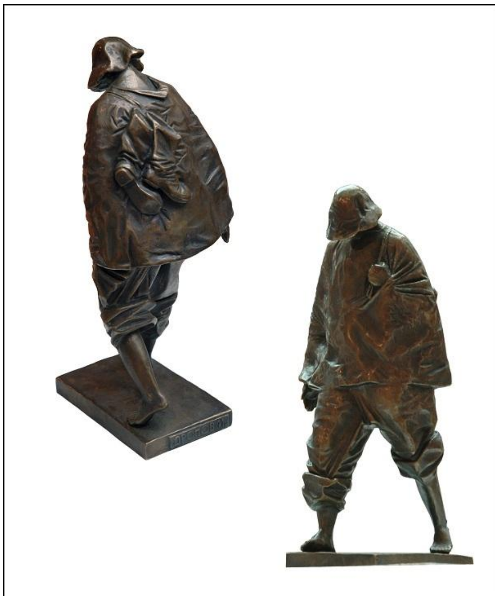
Михаил Дронов. Рыбак. 1984. Бронза. 30 x 8 x 14 см. Частное собрание

географически. Скульптор делал и делает различные пробы, в его творчестве присутствуют разные грани. Он может быть живописно-брутальным, с вызовом и дерзостью, как в случае с экспериментом Ночного дозора . А как скульптор-станковист он находится почти на полюсном понимании пластики, охватывая различные парадигмы скульптуры. Эта полюсность в его видении скульптуры прекрасно ощущалась в экспозиции работ Дронова, представленных на выставке в галерее «На Чистых прудах» 2 .