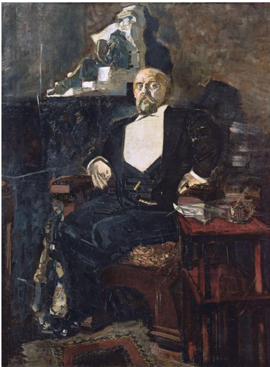
М.А. Врубель. Портрет Саввы Ивановича Мамонтова. 1897

Деятельность мамонтовского кружка была пестра и разнообразна. В то же время ее можно описать одной фразой Саввы Ивановича: «Надо приучить глаз народа к красивому на вокзалах, в храмах, на улицах». Помимо того, что в Абрамцеве активно развивалась русская национальная живопись, здесь, а также в московском доме Мамонтовых, происходило становление русской оперы. Именно в кругу мамонтовского кружка она прошла несколько стадий развития: устраивавшиеся в конце 1870-х годов воскресные «чтения» превратились за несколько лет сперва в «живые картины», затем – в любительские спектакли, обычно приходившиеся на Рождество (Савва Иванович был режиссером постановок, а зачастую и драматургом). Наконец, в 1885 году С.И. Мамонтов основал в Москве Частную оперу, ставшую на долгие годы его любимым детищем. Мамонтовская опера стала совершенно