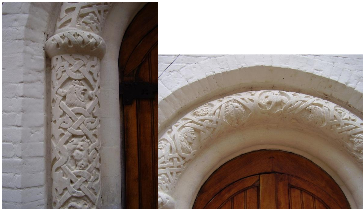
Фрагменты резьбы по камню, оформляющие вход в церковь