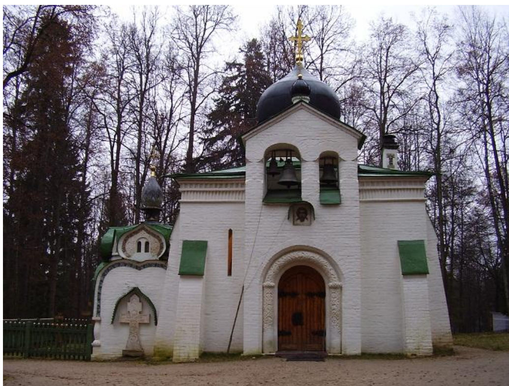
Церковь в Абрамцево