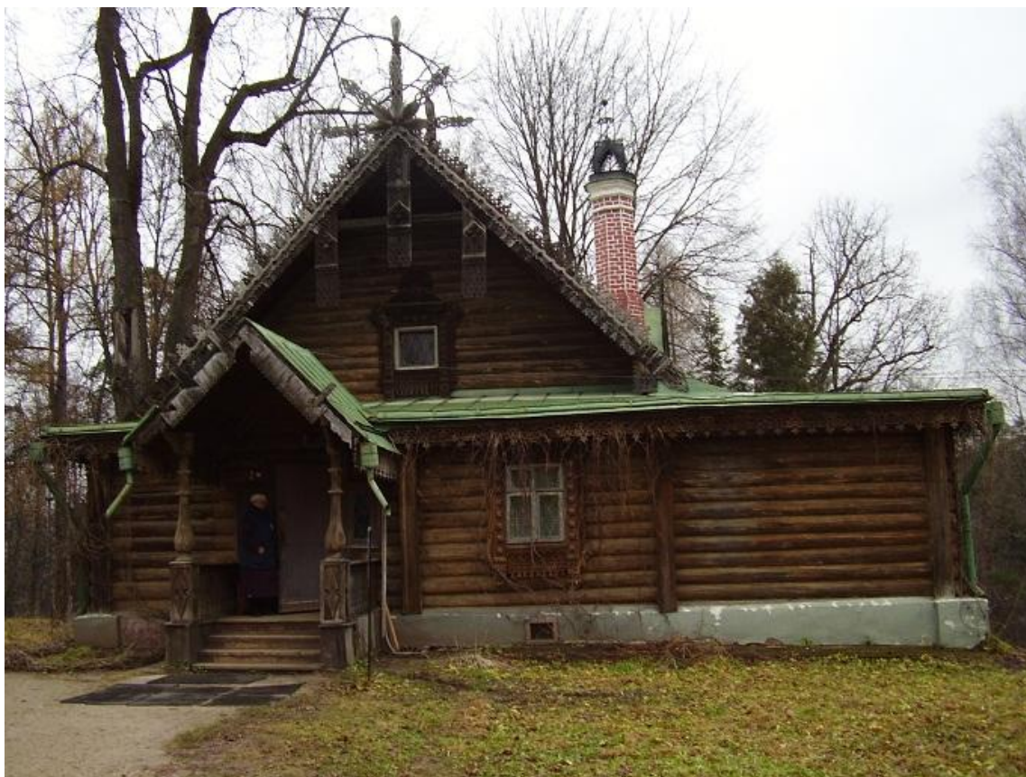
Мастерская усадьбы Абрамцево. Построена по проекту В.А. Гартмана. 1873