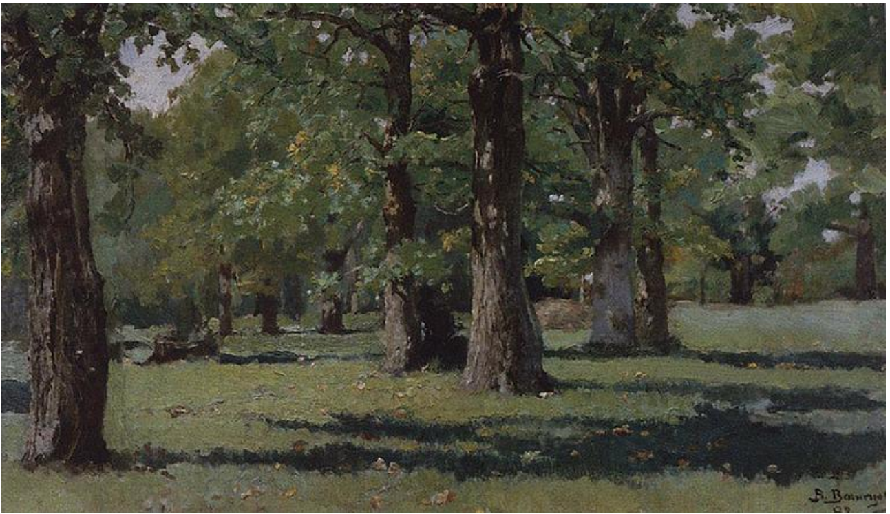
В.М. Васнецов. Дубовая роща в Абрамцево. 1883